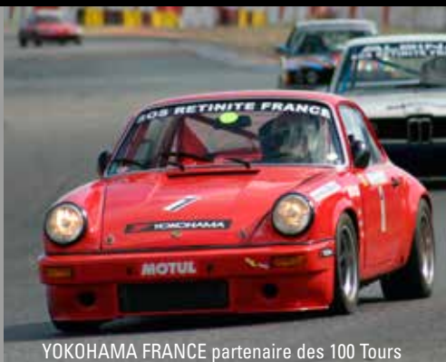
YOKOHAMA FRANCE partenaire des 100 Tours