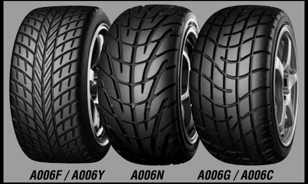
A006F / A006Y A006N A006G / A006C